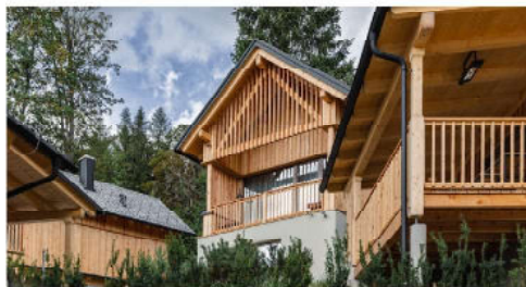
Das in die sanfte Landschaft eingebettete Bergdorf Montestyria bietet modernen Komfort auf höchster Stufe.

Sauna , und nur für Gäste zugänglichen Privat-Badesteg am nahegelegenen Erlaufsee ist die perfekte Destination um dem Alltag zu entfliehen.