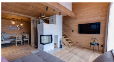
Hat man es aus den gemütlichen Schlafzimmern der Chalets geschafft, wartet bereits ein duftendes Frühstück.

Ein ausgiebiges Frühstück mit allem was das Herz begehrt kann auf Anfrage direkt in die Chalets bestellt werden. So startet man den Tag mit köstlichen steirischen Fruchtsäften, regionalen Schinken- und Käsespezialitäten, Bauernbrot vom Hofladen und frischem Obst und weiteren Delikatessen.