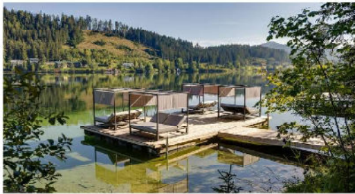
Am privaten Steg des Montestyrias lässt man am ruhenden Erlaufsee die Seele baumeln.

Auch für jüngere Besucher wird die Umgebung mit ihrem Erlebnisangebot wie das Holzknechtland, das Biberwasser, BikeAlps & WakeAlps und Wald8erBahn zum Paradies. Wilde Schluchten und beeindruckende Wasserfälle schmücken die nahe gelegenen Ötschergräben, die als Grand Canyon Österreichs gelten. Und auch am hoteleigenen Schwimmsteg am Erlaufsee taucht man durch das kristallklare Wasser zu einer Ausgeglichenheit von Körper und Seele.