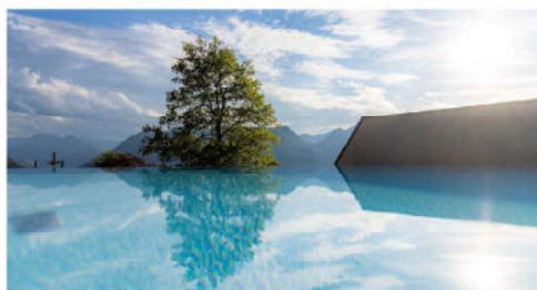
Wem das kristallklare Wasser des Bergsees zu frisch ist, kann am Pool die herrliche Aussicht beim Schwimmen genießen.

Nicht weniger exklusiv lässt es sich in den Junior-Suiten wohnen, welche auf 35 Quadratmetern einen südseitigen Wohn- und Schlafbereich mit Panoramafenstern bieten. Ein Bonus ist der direkte Zugang zum beheizten Pool mit grandiosem Ausblick.